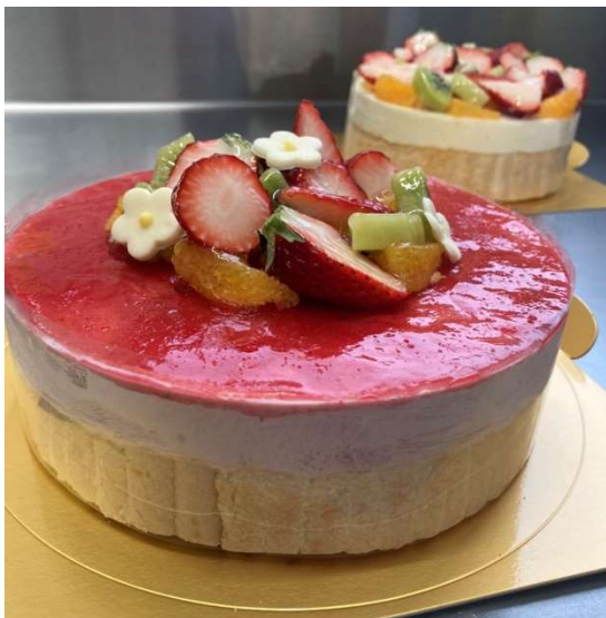
ベリーのムースケーキ (イチゴとベリーのブレンドジャム)&バニラムース)