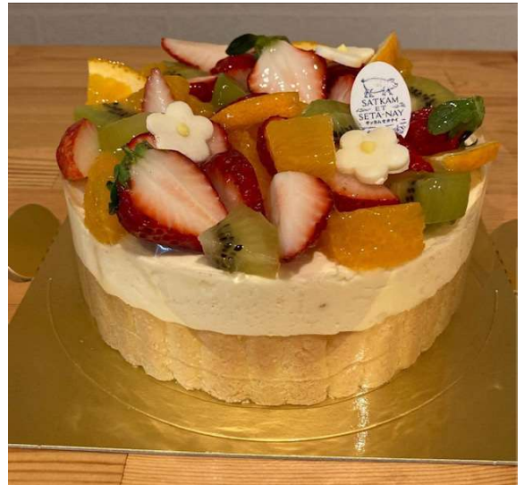
バニラムースケーキ (マダガスカル産バニラビーンズ使用)