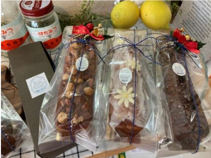
パウンドケーキ(ナッツ、蜂蜜、チョコ)